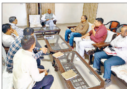
महेंद्रगढ़। जल निकासी व्यवस्था को मजबूत करने के निर्देश देते विधायक।

स्थानों पर स्थाई समाधान के लिए कार्य योजना बनाकर जल्द अमल किया जाए, जिससे शहर के नागरिकों को राहत मिल सके। महेंद्रगढ़ शहर के साथ-साथ गांवों का विकास भी सरकार की प्राथमिकता है। शहर और ग्रामीण क्षेत्रों में मूलभूत सुविधाओं को मजबूत करने के लिए लगातार विकास कार्य करवाए जा रहे हैं।