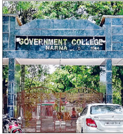
नारनौल। कॉलेज भवन।

■ शिक्षा विशेषज्ञों का तर्क : किसी भी शैक्षणिक संस्थान के सुचारु संचालन के लिए प्राचार्य की भूमिका सबसे महत्वपूर्ण, पद रिक्त होना चिंता का विषय