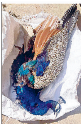
मंडी अटेली। रातां में करंट लगने के बाद जमीन पर पड़ा राष्ट्रीय पक्षी।