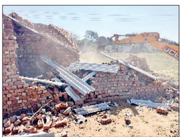
नारनौल। अवैध कॉलोनी में तोड़फोड़ करती जेसीबी मशीन।