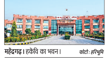
महेंद्रगढ़। हर्कति का भवन।

को अपना आशीर्वाद देंगे। कुलपति ने सभी अधिकारियों को निर्देश दिए हैं कि वे दीक्षांत समारोह के लिए सभी तैयारियां प्राथमिकता के आधार पर पूरा करें। कुलपति ने कहा कि गत वर्षों की तरह 12वां दीक्षांत समारोह भी भव्य होने वाला है। उन्होंने कहा कि दीक्षांत समारोह किसी भी शिक्षण संस्थान का सबसे महत्वपूर्ण अकादमिक कार्यक्रम होता है। यह