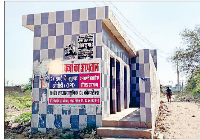
नारनौल। ट्रामा सेंटर के सामने बनाया गया जनसुविधा स्थल।

नगर परिषद की ओर से वर्ष 2025 में करीब 15 लाख रुपये की राशि खर्च कर शहर के 18 जनसुविधा स्थलों के सुधारीकरण की योजना बनाई गई थी। इस योजना के तहत शौचालयों में नई टॉयलेट सीटें, वॉश बेसिन, यूरिनल, पानी की टैंकियां, नल तथा फ्लश सिस्टम लगाए गए थे। परिषद का उद्देश्य था